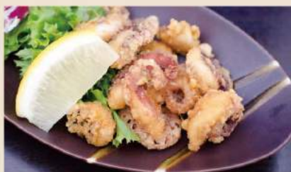
🍴 ピリ辛! タコの唐揚げ Frittierte Oktopusstückchen (pikant gewürzt) 7€