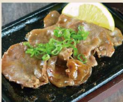
▼ 厚切り牛タンネギ塩焼き extra dick geschnittene Rinderzunge 12€