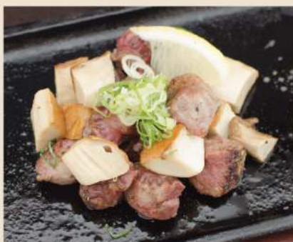
▼ 砂肝とエリンギのんにく黒胡椒炒め Gebratener Hähnchenmagen Kräuterseitlinge und Knoblauch 8€