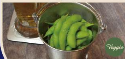
🍴 枝豆 Edamame 4€