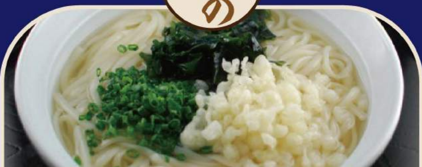
🍴 わかめたぬきうどん、たぬきそば Weizennudelsuppe oder Buchweizennudelsuppe 10,50€