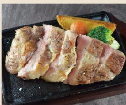
▼ イベリコ豚の天然塩焼き Gegrilltes Nackensteak vom Iberico Schwein 14,50€