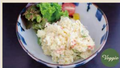
🍴 ポテトサラダ Japanischer Kartoffelsalat mit Kartoffeln 5,50€