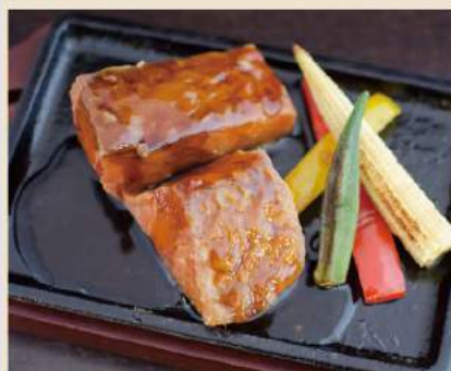
▼ 鮭の照り焼き Lachs TERIYAKI 10,50€