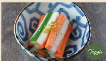
🍴 季節野菜のゆず酢漬け Eingelegtes Gemüse in Yuzu-Marinade 5€