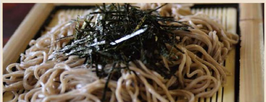
🍴 ざるうどん、ざるそば Kalte Weizennudeln mit Suppe oder Kalte Buchweizennudeln mit Suppe 10,50€