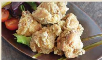
🍴 柚子胡椒風味 鶏の唐揚げ Frittierte Hähnchenstücke 8,50€