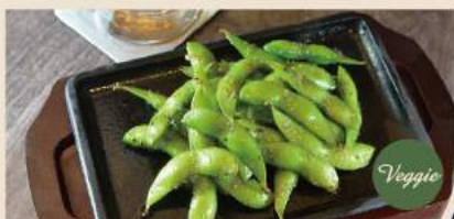
🍴 焼き枝豆 黒麻油 Geb.Edamame mit Knoblauch & Sesamiöl 5,50€