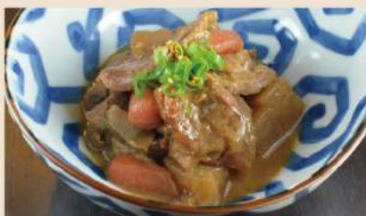
🍴 牛すじ味噌煮込み Geschmortes Rinderfleisch und Gemüse mit Miso 7€