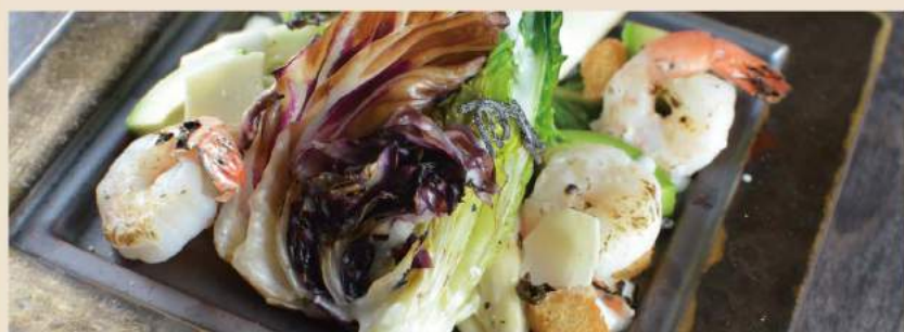
🍴 鉄板『焼』シーザーサラダ 海老とアボカド Gebratener Ceaser Salad nach Yaki-The-Emon Art (mit Garnele und Avocado) 13€