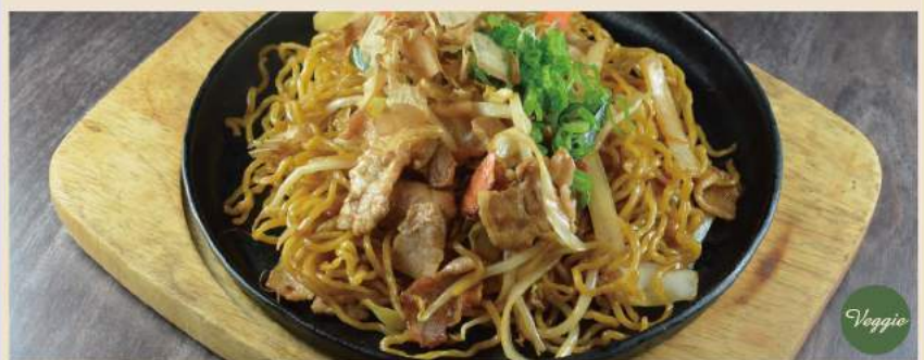
🍴 焼左衛門の鉄板焼きそば 豚肉 / 野菜 Gebratene Nudeln mit Schweinefleisch und Gemüse 12.50 € oder vegetarisch 11.50 €