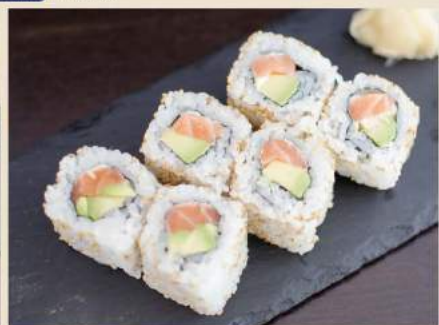
鮭アボロール Lachs-Avocado-Rolle 7€