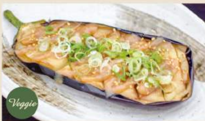
🍴 なす田楽 Gebratene Aubergine mit Misoße 7,50€