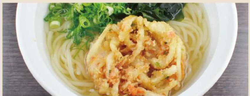
🍴 かき揚げうどん、かき揚げそば Weizennudelsuppe mit Gemüse Tempura oder Buchweizennudelsuppe mit Gemüse Tempura 13.50 €