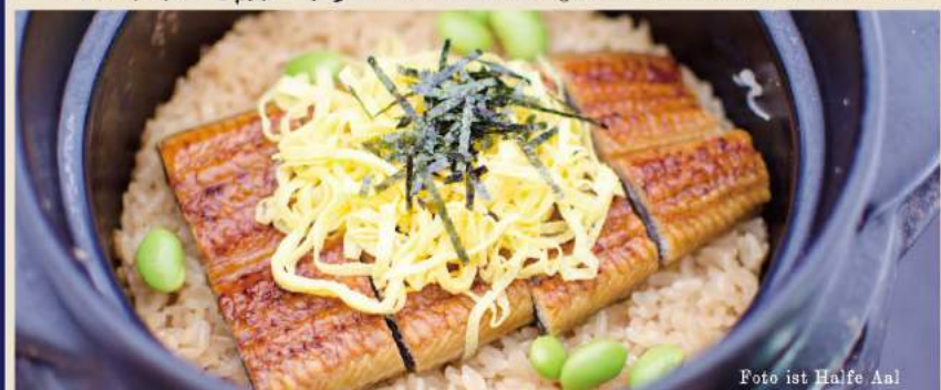
Foto ist Halfe Aal

土鍋炊き！季節の炊き込み御飯 3～4人前 (für3-4per.) ズワイガニと鮭いくら Donabe mit Lachsrogen, Krabbenfleisch und Lachs 36€