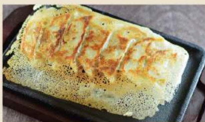
🍴 羽根つき一口焼き餃子 GYOZA (Hähnchenfleisch & Gemüse) 6,50€