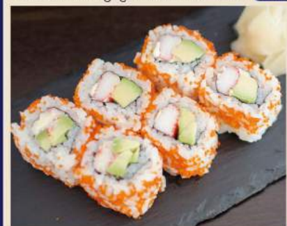
カリフォルニアロール California-Rolle 7€

土鍋炊き！ふっくら鰻飯 3～4人前 (für3-4per.) Donabe mit gegrilltem Aal 33€ Extra Aal +10€