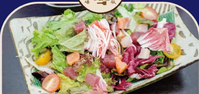
🍴 焼左衛門海鮮サラダ Meeresfrüchte-Salat mit "Fang des Tages" -Fischen 10,50€