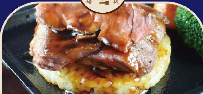
▼ 牛ハラミ鉄板焼き Gegrilltes Rindersteak 16€