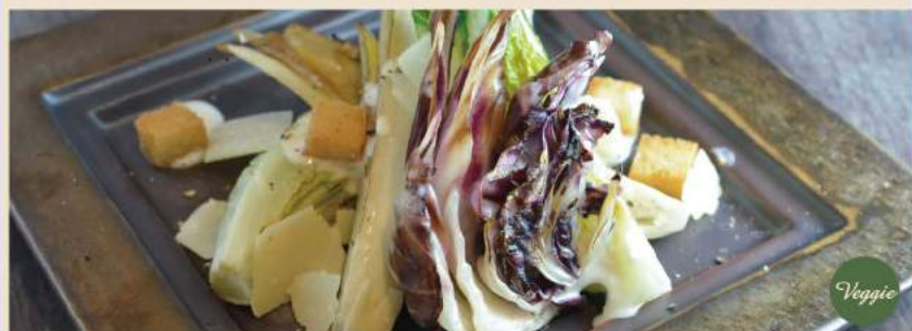
🍴 鉄板『焼』シーザーサラダ Gebratener Ceaser-Salad nach Yaki-The-Emon Art 9€