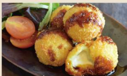
🍴 もちもちチーズコロッケ Japanische Kroketten (Kartoffel, Reiskuchen & Käse) 7€