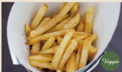
🍴 ふりふりほてと Schüttel-Pommes in verschiedenen Geschmacksrichtungen. Wählen Sie einen Geschmack aus. Sie werden am Tisch gewürzt. 5,50€