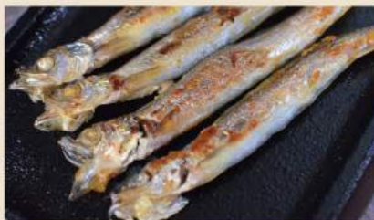
🍴 焼きししゃも Gegrillte Kapellenfische 6€