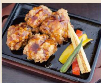
▼ 若鶏の照り焼き Hähnchen TERIYAKI 10,50€