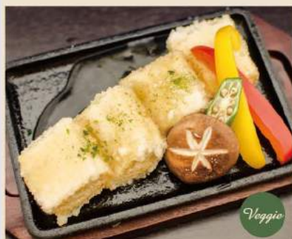
▼ 鉄板豆腐ステーキ Tofu-steaks mit japanischer Sosse 7€