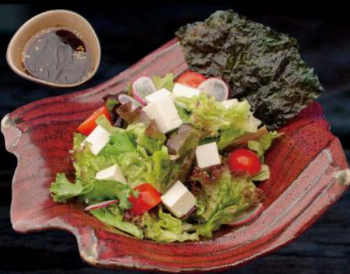
阿咩サラダ AH-UN SALAT GEMISCHTER SALAT MIT SEIDENTOFU UND HAUSGEMACHTEM DRESSING 8,50 €