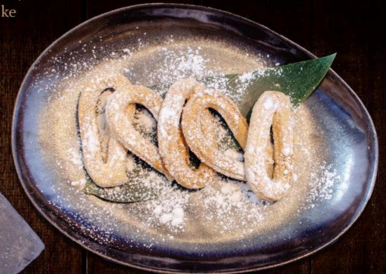
きな粉チュロス Kinako ( Sojamehl) Churros 5,00 €