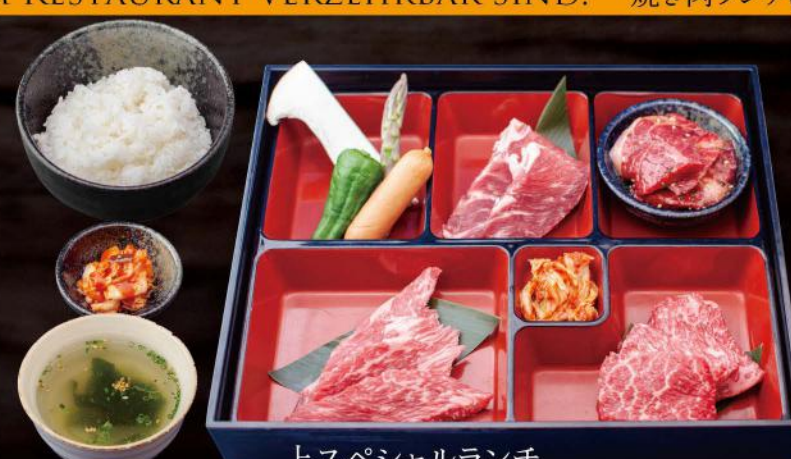
上スペシャルランチ JO SPECIAL LUNCH 上カルビ・壺漬けカルビ・上ロース・イベリコ豚肩ロース・ライス・スープ・キムチ WAGYU QUERRIPPE, MARINIERTE WAGYU QUERRIPPE, WAGYU HOCHRIFFE, IBERICO SCHWEINENACKEN, MIT REIS, SUPPE UND KIMCHI 38,50 €