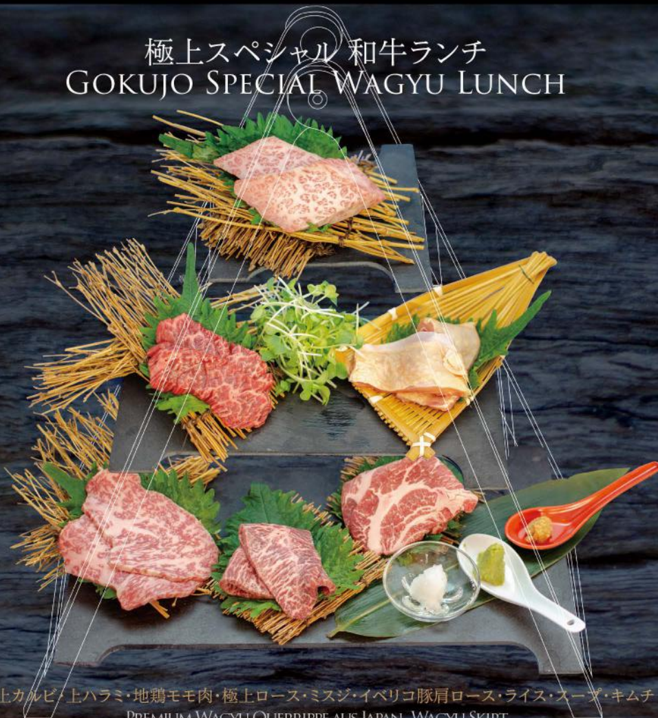
極上カルビ・上ハラミ・地鶏モモ肉・極上ロース・ミスジ・イベリコ豚肩ロース・ライス・スープ・キムチ PREMIUM WAGYU QUERRIPPE AUS JAPAN, WAGYU SKIRT, HÄHNCHENSCHENKEL AUS FRANKREICH LABEL ROUGE, PREMIUM WAGYU HOCHRIFFE, SCHILDSTÜCKE WAGYU, IBERICO SCHWEINERÜCKEN, MIT REIS, SUPPE UND KIMCHI 58,50 €