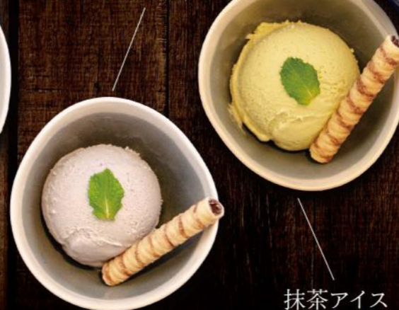
黒ゴマアイス Schwarzer Sesam Eis 4,00 €