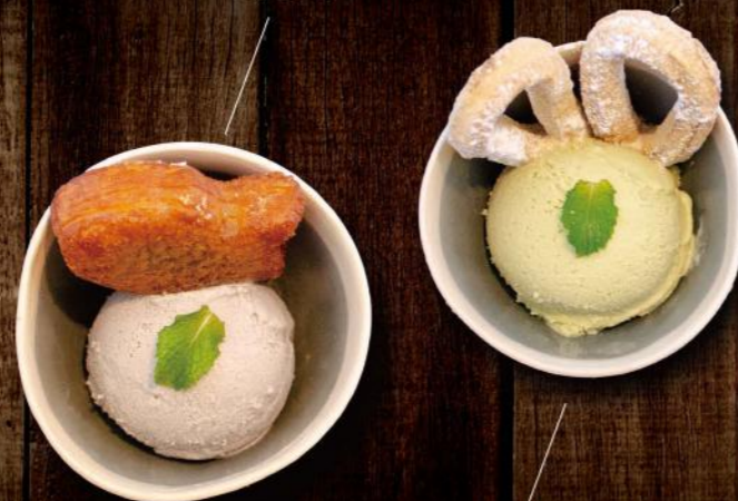
ミニたい焼きとアイスのセット Mini Taiyaki Eis Set ( Matcha oder Sesam Eis) 5,50 €