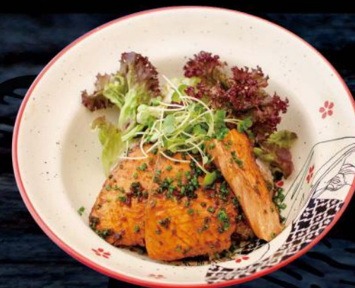
焼き鮭丼/キムチ、スープ付き AH-UN SHAKE DON LACHS UND SALAT AUF REIS NACH JAPANISCHER ART, MIT EINER TAGESSUPPE UND KIMCHI 13,50 €