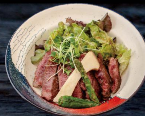
ステーキ丼/キムチ・スープ付き STEAK DON SKIRT STEAK UND SALAT AUF REIS NACH JAPANISCHER ART, MIT EINER TAGESSUPPE UND KIMCHI 16,50 €