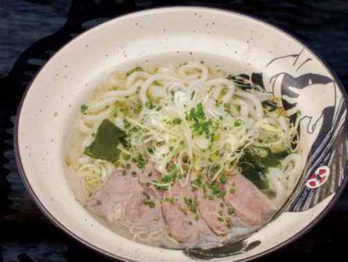
鴨南蛮うどん KAMO UDON WEIZENUDELSUPPE MIT ENTE 12,50 €