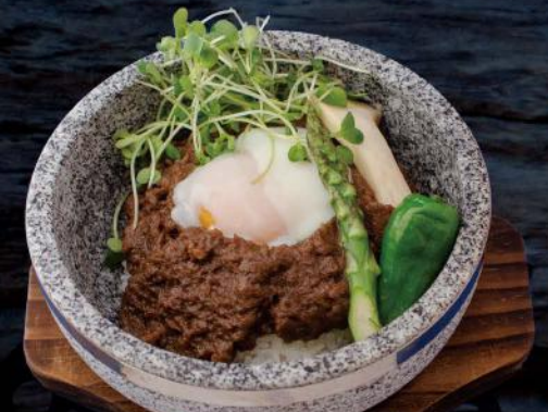
和牛石焼きキーマカレー キムチ・スープ付き JAPANESE WAGYU CURRY JAPANISCHES CURRY MIT WAGYU HACKFLEISCH AUF REIS IN EINEM HEIBEN STEINTOPE SERVIERT, MIT EINER TAGESSUPPE UND KIMCHI 14,50 €