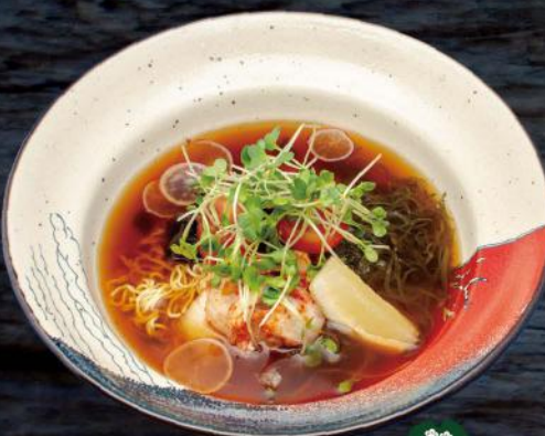
冷やしラーメン HIYASHI RAMEN (KALT) KALTE NUDELSUPPE MIT NORIPASTE, WASABIALGE UND KIMCHI 12,00 €

BITTE HABEN SIE VERSTÄNDNIS, DASS DIE UNTEN AUFGELISTETEN GERICHTE NUR IM RESTAURANT VERZEHRBAR SIND. 焼き肉ランチはテラス席ではご注文いただけません。ご了承ください。