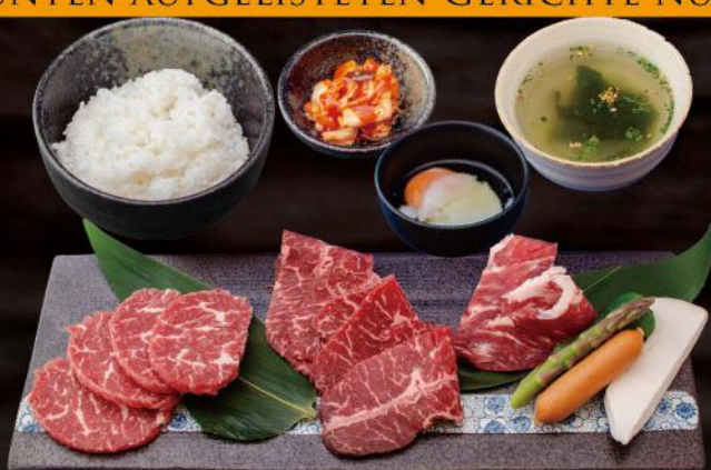
焼きすきランチ/YAKI SUKI LUNCH 焼きすきサーロイン・焼きすきミスジ・焼きすき豚肩ロース・温玉・ライス・スープ・キムチ HAUCHDÜNN GESCHNITTENE QUERRIPPE, HAUCHDÜNN GESCHNITTENE HÜFTEN, HAUCHDÜNN GESCHNITTENER SCHWEINENACKEN MIT HALBROHEM EI IN SÜßER SOJASOBE ZUM DIPPEN MIT REIS, SUPPE UND KIMCHI 28,50 €