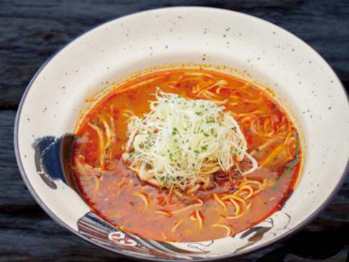
辛味噌ラーメン SPICY MISO RAMEN SCHARFE NUDELSUPPE MIT WAGYU SCHREIBEN 14,00 €