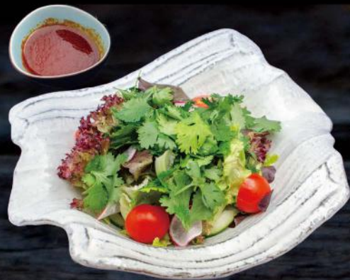
ピリ辛パクチーサラダ KORIANDER SALAT GEMISCHTER SALAT MIT KORIANDER UND HAUSGEMACHTEM DRESSING 9,00 €