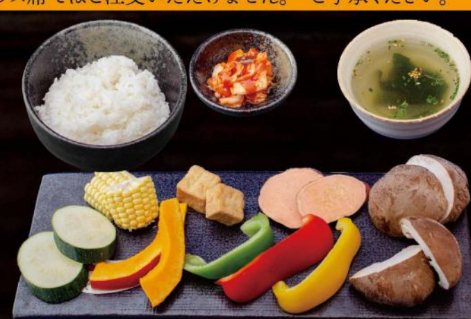
ベジタブルランチ VEGETABLE LUNCH 野菜各種 ライス・スープ・キムチ VERSCHIEDENE GEMÜSESORTEN MIT REIS, SUPPE UND KIMCHI 13,50 €